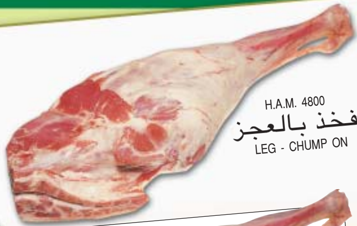
H.A.M. 4800 فخذ بالعجز LEG - CHUMP ON