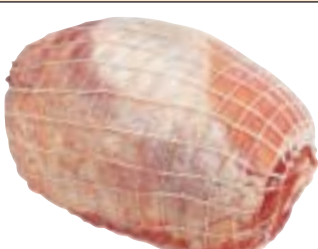
H.A.M. 5050 الكتف ملفوفة بشبك SHOULDER - ROLLED/NETTED