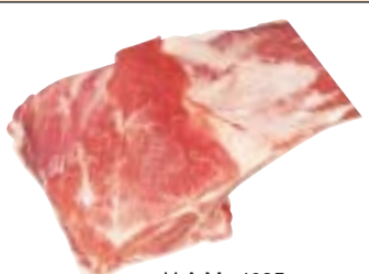
H.A.M. 4935 أضلاع الكتف SHOULDER RACK