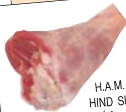
H.A.M. 5031 HIND SHANK ساق خلفية (موزة)