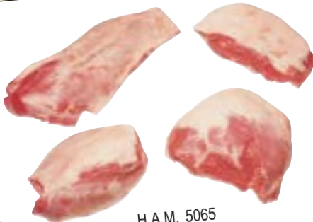
H.A.M. 5065 قطع الفخذ LEG CUTS