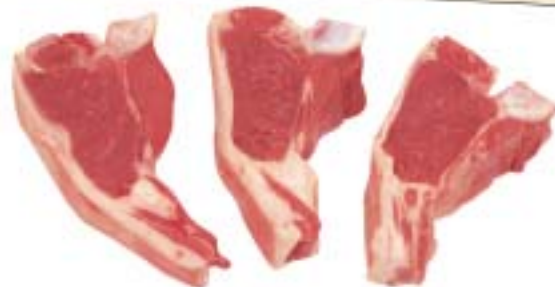
ريش أضلاع قصيرة SHORTLOIN CHOP