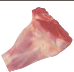
H.A.M. 5030 ساق أمامية FORE SHANK