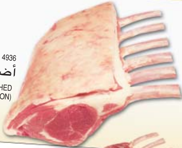
H.A.M. 4936 أضلاع منسقة RACK - FRENCHED (CAP ON)