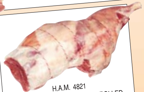
H.A.M. 4821 فخذ بدون عظم LEG ROLLED