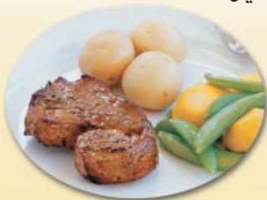
H.A.M. 4880 أضلاع قصيرة SHORT LOIN