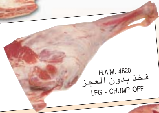
H.A.M. 4820 فخذ بدون العجز LEG - CHUMP OFF